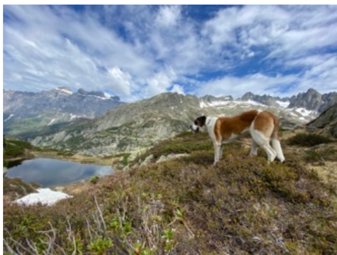
Minus du Grand St. Bernard, Sustengebiet

Le point de départ de cette randonnée facile se situe au parking de l'Hotel Steingletscher sur la route du col du Susten. C'est sur la route encore goudronnée que nous avons démarré notre marche en direction de Steinsee. Arrivés vers le lac nous avons suivi le bord en direction de l'ancienne langue du glacier. L'eau fraîche incita très vite les chiens à se baigner et leurs ébats ne tardèrent pas à mouiller nos pantalons.